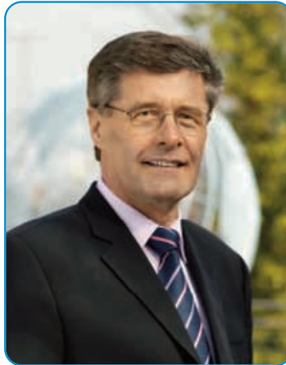
Friedel Heuwinkel, Landrat

und rund 700 Mitglieder freuen, die aktiv und voller Motivation viele verschiedene Sportarten betreiben wie zum Beispiel Volleyball, Radfahren, Laufen und natürlich Turnen.