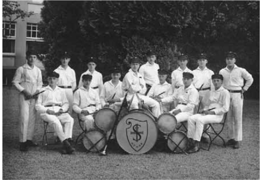
Das Trommler- und Pfeiferkorps im Jahre 1926

Pivitsheide, V. L. Vor nunmehr 25 Jahren legten vier Pivitsheider den Grundstein zu dem Trommlerkorps. Der bald sehr bekannte Spielmannszug erhielt erheblichen Zuwachs aus dem damaligen Arbeiter-Turn- und -Sportverein. 1933 löste man nicht nur die Gruppe auf, sondern beschlagnahmte auch die Instrumente, obwohl sie Privateigentum waren. Um wenigstens weitere Übungsstunden abhalten zu können, schloß man sich der Feuerwehr an. Im vergangenen Jahres fanden sich zehn Spieler wieder zusammen. Am ersten Ostertag wird das Trommlerkorps aus Anlaß des 25jährigen Bestehens zum erstenmal wieder ein großes Gartenkonzert bei Barkemeier (Eichenkrug) veranstalten, das allen Gelegenheit gibt, ihre Verbundenheit mit dem „Jubiläum“ zu beweisen.